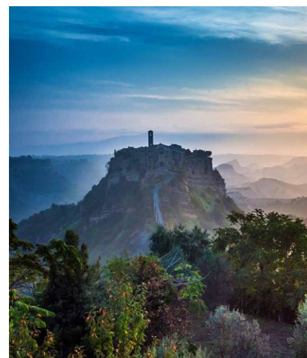
Civita di Bagnoregio