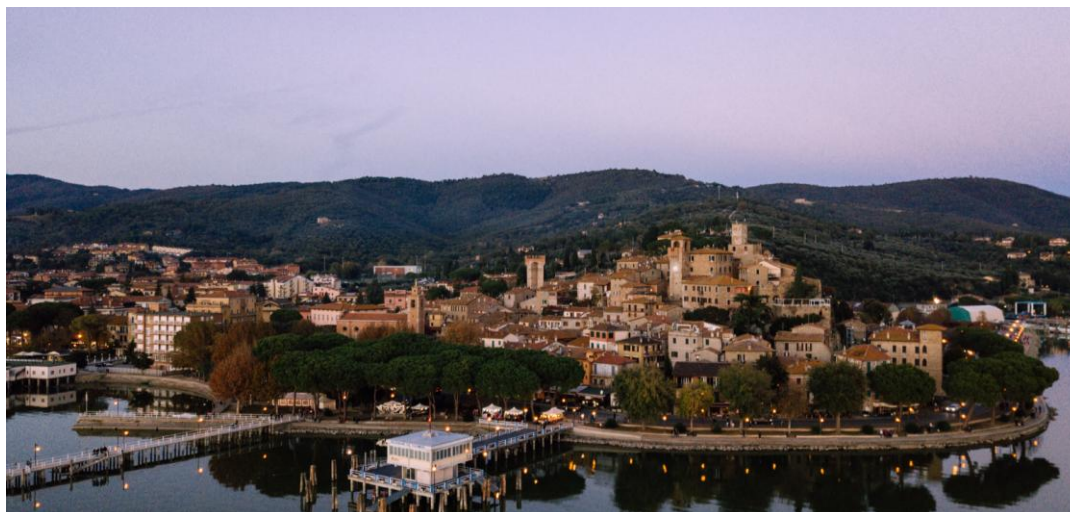
Passignano sul Trasimeno

26-29 Mai 2022 – May 26th-29, 2022 Passignano sul Trasimeno/Castiglione del Lago/Panicale (Italie)