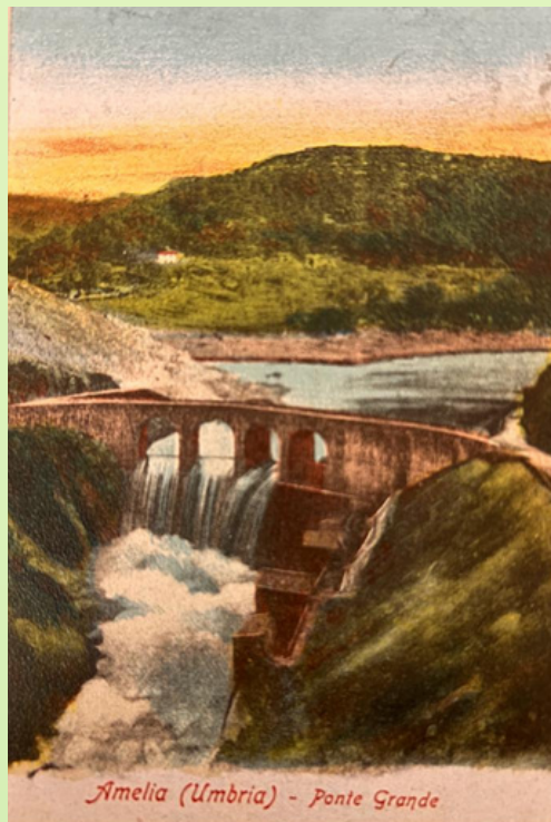
Amelia (Umbria) - Ponte Grande